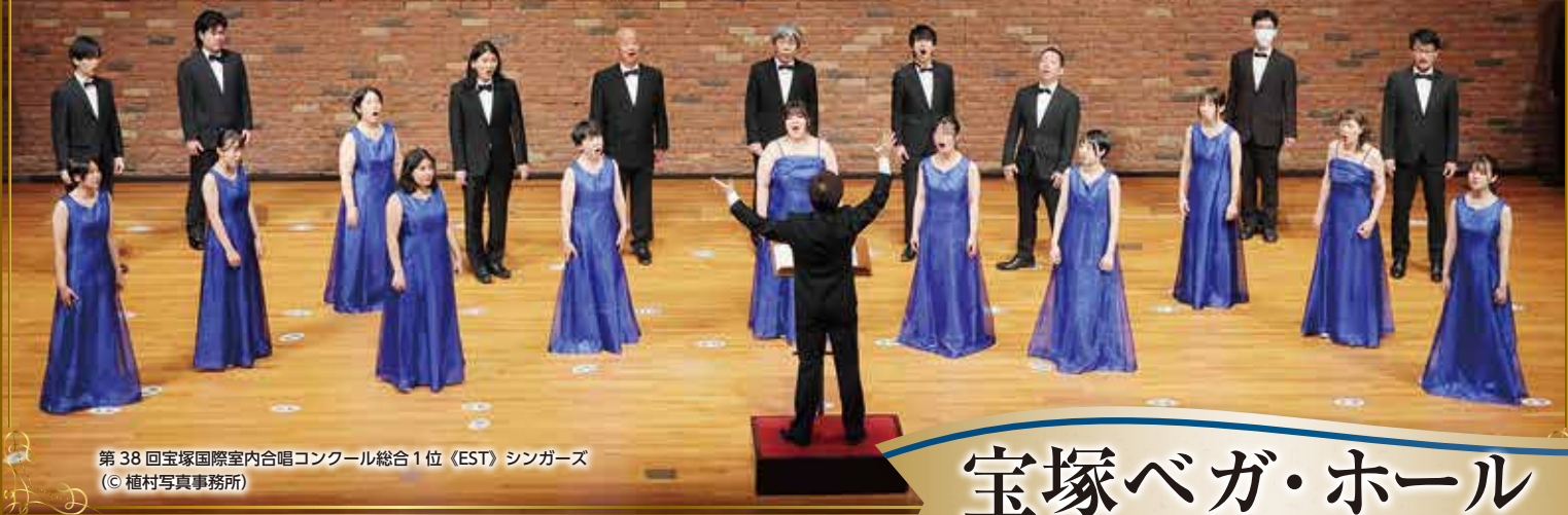
第38回宝塚国際室内合唱コンクール総合1位〈EST〉シンガーズ

The 39th Takarazuka International Chamber Chorus Contest